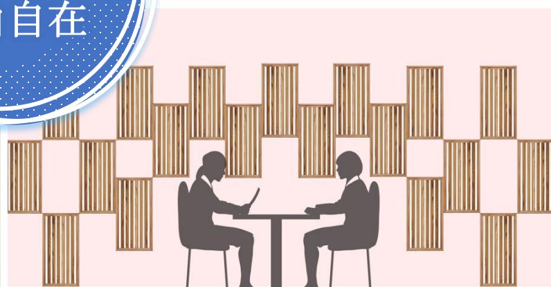
イメージ木部：国産杉無垢材 塗装色：クリア